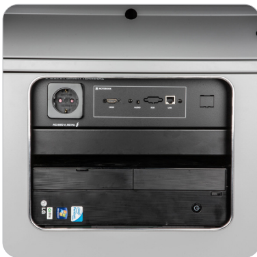
① 외부입력 단자대