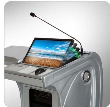
③ 모니터 전동 각도조절

모니터 전동 각도조절(0 ~ 90도 조절) 7인치 LCD 터치로 원하는 각도로 조절가능