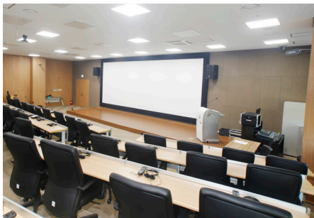
< 정면 >