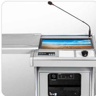
② 제어패드와 마우스패드 일자 배열