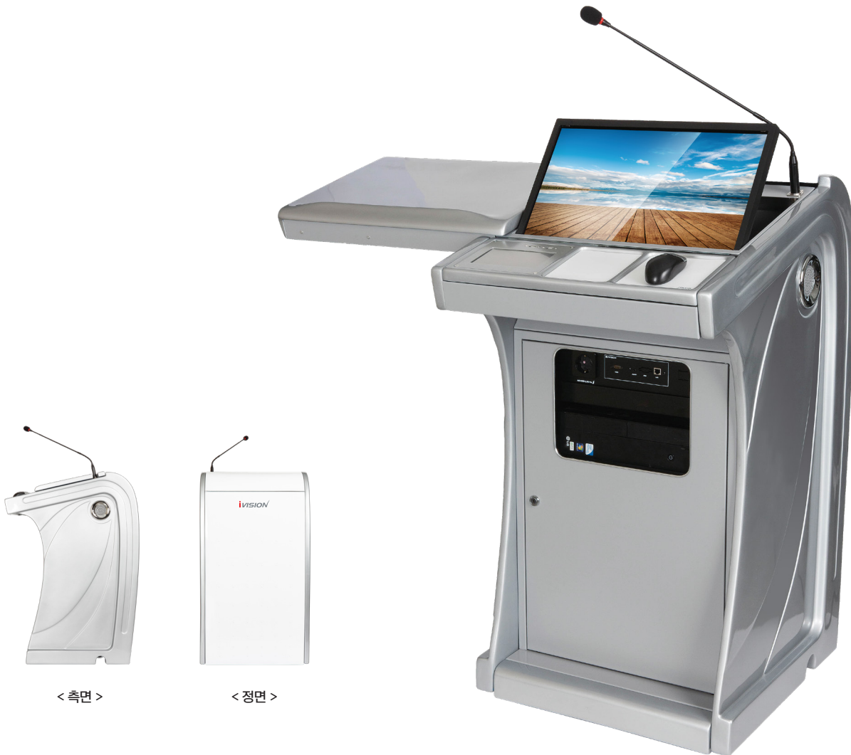
< 측면 >

IBL Series 전자교탁시스템은 금형에 의한 양산 제품으로 경화성 강화플라스틱 복합재료인 FRP재질로 경량 설계되어 이동성이 용이하고 부식성 및 내구성이 우수한 반영구적인 전자교탁입니다.